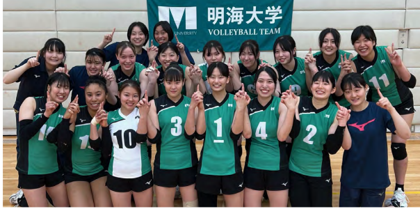
女子バレーボール部

今季から関東大学女子1部バレーボールリーグのステージに立った本学体育会女子バレーボール部は、9月から10月にかけて行われている「2024年度秋季関東大学女子1部バレーボール