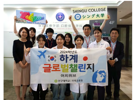
シング大学の学生と保健医療学部の教員たち

導実習」および「基礎歯科診療補助実習」を見学した後、保健医療学部の教員や学生に本学での歯科衛生士養成カリキュラムや日本の歯科衛生士を目指す学生の様子についてインタビューを行った。学びへ積極的な姿勢を見せるシング大学の学生たちに、本学の学生たちも良い刺激を受けた様子が見受けられた。