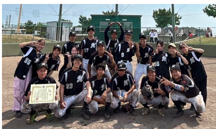
歯学部硬式野球部

8月1日から6日にかけて、みなと堺グリーンひろば硬式野球場(大阪府堺市)で開催された「第56回全日本歯科学生総合体育大会」において、硬式野球部が見事準優勝に輝いた。1回戦は朝日大学に32-0、2回戦は九州歯科大学に14-7、準決勝は日本歯科大