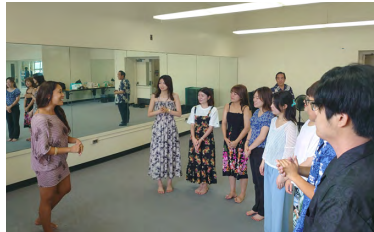
ホスピタリティ・ツーリズム学科の研修の様子

浦安キャンパスからは57人の学生が夏期海外研修に参加した。学生たちは現地大学での語学研修だけでなく、各学科の学びに合わせて、企業への訪問や現地文化に触れるフィールドワークなど、多彩なプログラムに参加した。日頃の授業だけでは得られない貴重な体験や、研究分野の理解を深める生きた知識に触れることができ、国際未来社会に目を向ける良い機会となった。