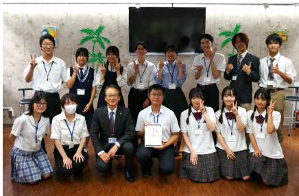
中城学部長(前列右3番目)と参加学生たち

9月8日、不動産学部主催の『2024 高校生が考える「空き不動産活用コンテスト」最終審査会』が浦安キャン