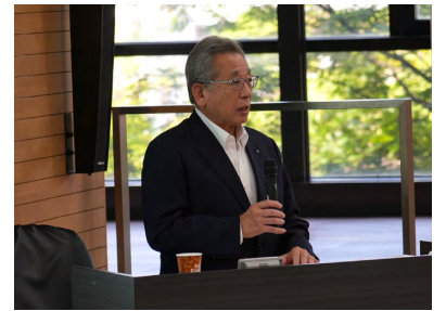
JAいちかわ今野組合長 講演の様子

学生たちは、今まで曖昧だったSDGsの理解が明確になったようで「具体的な取り組みの話はとても興味深く、意外と身近なことで自分も役に立てそう」という声が聞かれた。今後も外国語学部は建学の精神に基づき学生たちの国際感覚を涵養する教育を推進していく。