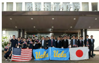
正面玄関での集合写真

“Digital workflow and education in UCLA Restorative Dentistry”