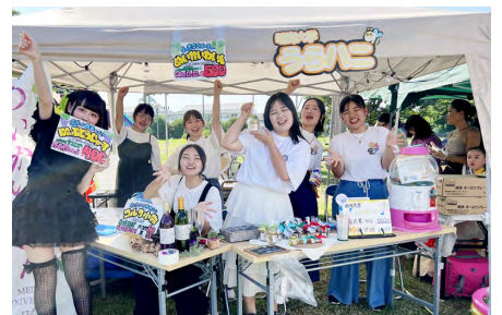
販売を行うホスピタリティ・ツーリズム学部の学生たち

参加した学生からは「暑い中、お祭りに足を運んでくださった地域の方々や子どもたちと交流ができ、貴重な機会になった」との声が聞かれた。