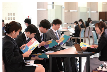
採用担当者の話を熱心に聞く学生たち

るために1年次から4年次まで一貫して継続するキャリア教育を行っており、今後も万全の体制で学生たちのサポートをしていく。