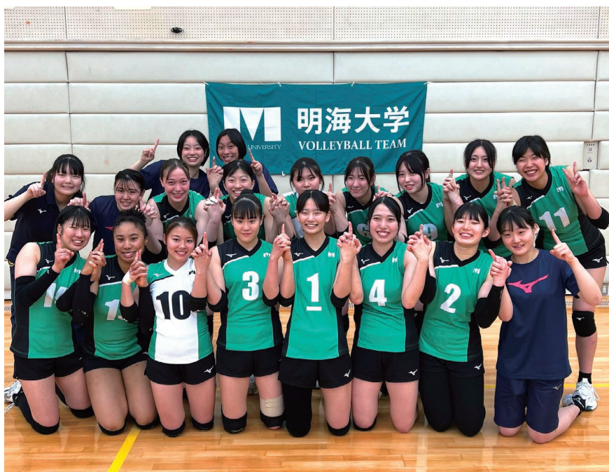
昇格を決めた女子バレーボール部

4月13日から5月19日にかけて行われた「2024年度関東大学バレーボール春季リーグ」女子2部リーグで、全11試合全勝でリーグ優勝を勝ち取り、女子1部昇格決定戦においても勝利を収め創部5年で1部昇格を決めるという快挙を達成した。