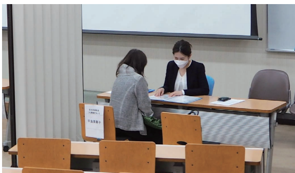
アカデミックアドバイザーと個別面談の様子