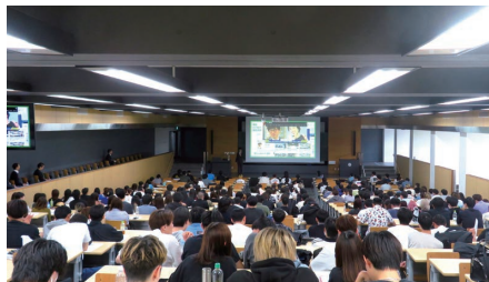
就職ガイダンスIの様子

6月4日、浦安キャンパスにおいて「就職ガイダンスI」を開催。大学3年生を対象に「行きたい会社の見つけ