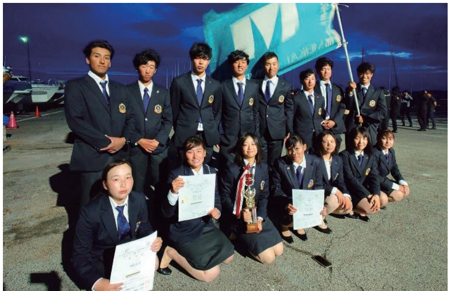
表彰式後のヨット部