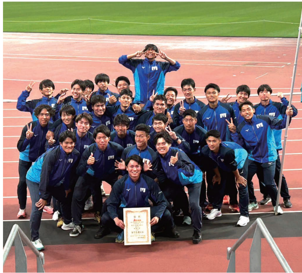
国立競技場で表彰式後の陸上競技部