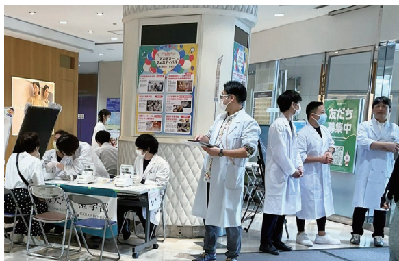
フェスティバル会場の様子