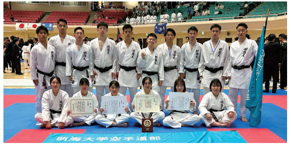
表彰式を終えた空手道部