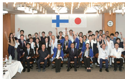
歓迎ランチパーティー後の一同