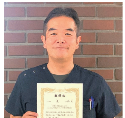
表彰状を手にする森准教授