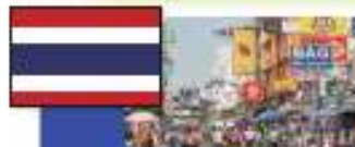
Bangkok, Thailand (バンコク タイ)